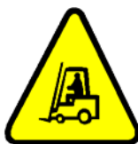
Vehicule de transportare