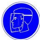
Mască de protecție Obligativiu