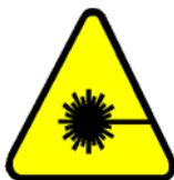
Radiații cu laser