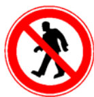
Interzis pentru pietoni