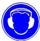
Căști de protecție a auzului Obligativiu