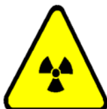
Substanțe radioactive sau radiații ionizante