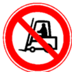
Interzis pentru mijloacele de transport