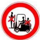
Interzisă transportarea persoanelor pe vehicule