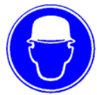
Cască de protecție Obligativiu