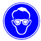
Ochelari de protecție Obligativiu