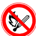
Fumatul și flăcările deschise interzise