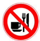
Interzisă mâncarea și băutura